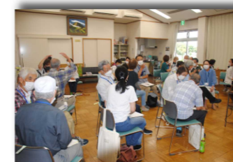
《ペアワークの様子》