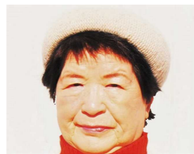
昭和を唄う からたちの花

若い頃より関心のあった音楽系の内容をとおり、キーボードをたずさえて市内の施設等を訪問した際、足立区から来ている楽器演奏のボランティアさん達と出会い、その中でヴァイオリンの方に誘われ二人でチームを作りました。八潮はもとより、足立区内の住区センター約20カ所、草加、越谷、吉川等要望のある所へはどこへでも訪問しました。一度訪問すると次の年も依頼があるので、コロナ禍の前は年間50回は行っていました。昭和の歌謡曲、童謡等になじみが深い高齢の方々には、楽器演奏に合わせて皆で歌を歌ったり、曲当てクイズ等をしたりしていました。