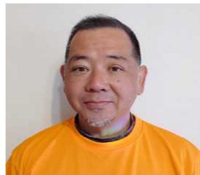
こども応援団・結