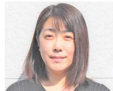
あかみみおんがく