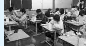
▲ベルマークの回収