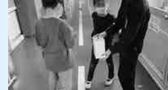
▲赤い羽根募金活動