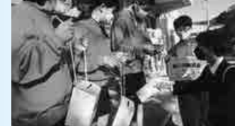
▲赤い羽根募金活動