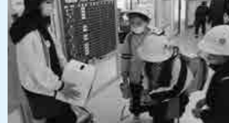
▲赤い羽根募金活動