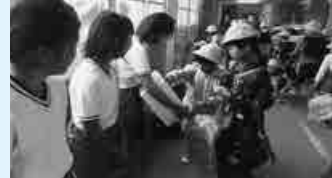
▲赤い羽根募金活動