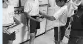
▲赤い羽根募金活動