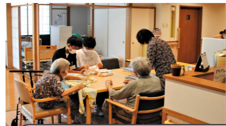
▼特別養護老人ホーム 杜の家やしお