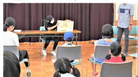
▼朗読ボランティア うしお文庫

コロナ禍で地域の方々と接する機会が減ってしまっただけで、こういったふれあえる場、機会というのは大切だと思った。