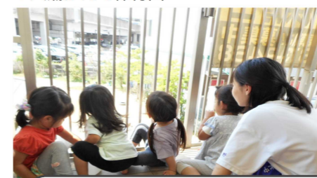
▼八潮かえで保育園