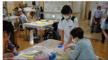
▼高齢者福祉施設 やしお苑