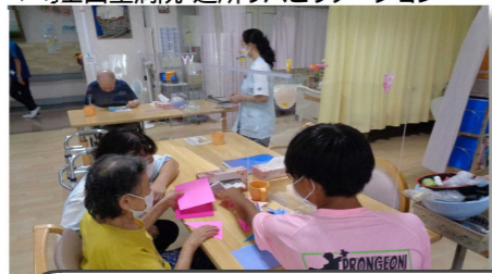
▼埼玉回生病院 通所リハビリテーション

普段することのない体験をでき、楽しかった。また、働いている人がどのように患者さんと接しているか見ることができてよかった。