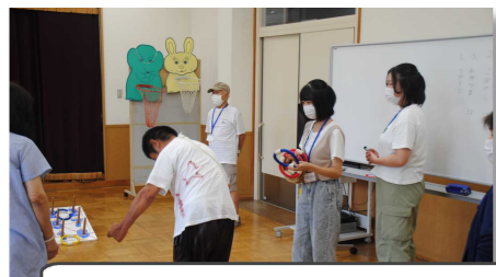
▼八潮市身体障害者福祉会