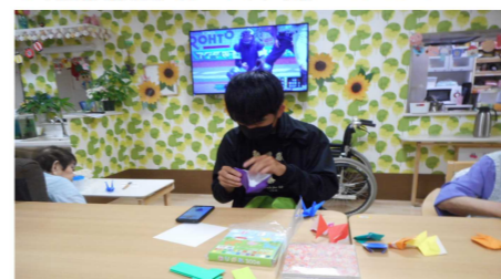
▼特別養護老人ホーム 八潮いこいの里