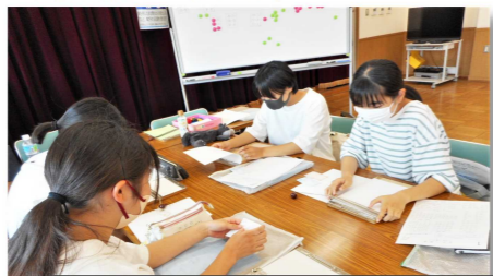
▼点字点訳 ひまわりの会