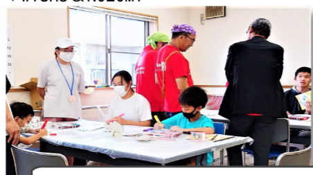
▼WISH8 & NOZOMI

高齢の人や障がいを持った人など、普段あまり関わることのない人たちと関わることができて良い経験になった。