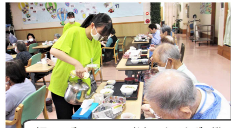
▼デイサービス・グループホーム ぼっかぼか

初めてボランティアに参加したけれど、働いている方たちが優しく教えてくれて、楽しく参加することができた。