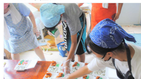
▼こども食堂ほっぺ

今までボランティア活動といわれると自信がなくて行かないことがほとんどでしたが、行ってみてとても楽しかった。