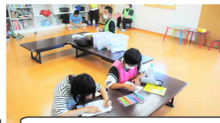
▼放課後等デイサービス さとっこ

私たちには気づかない視点から物事をみているため、子どもたちから学ぶことが多く、一緒に喜怒哀楽を感じることができた。