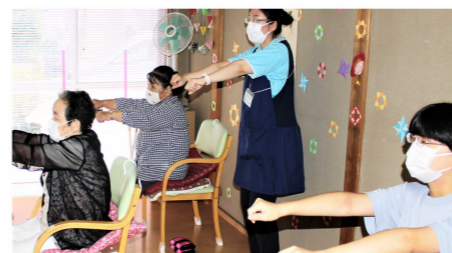
▼通所型サービスA事業所 寿楽荘