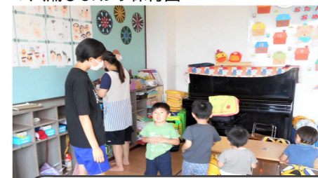
▼八潮ひまわり保育園

想像していたより気をつけなくてはいけないことがあって、一番大切なことは周りのことをよく見ることだと思った。