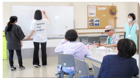
▼八潮市身体障害者福祉センターやすらぎ