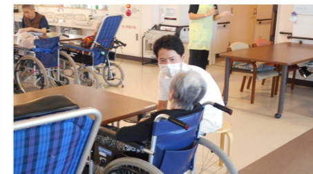
▼ふるさとホーム八潮