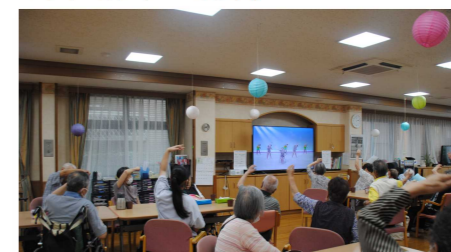
▼ケアセンターそよ風