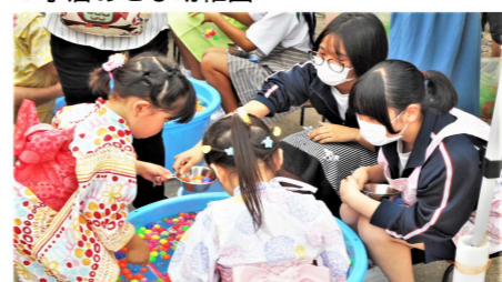
▼小倉あさひ幼稚園