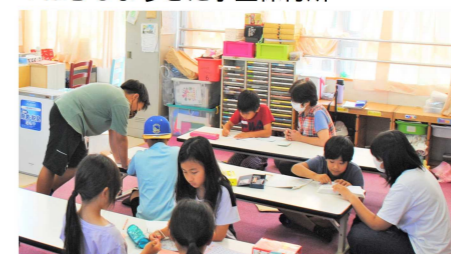
▼はちじょうきた学童保育所

子どもたちがどうしたら喜ぶか考えて活動した。大変な仕事だけどそのなかにも楽しさがあった。すごく良かった。