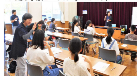
▼八潮市手話サークル うさぎの会