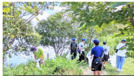
▼やしおの川をきれいにする会