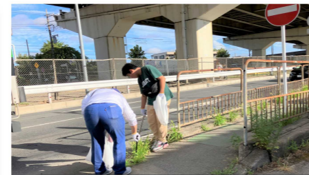
▼八潮ロータリークラブ