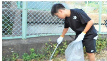
▼八潮市商工会クリーンプロジェクト