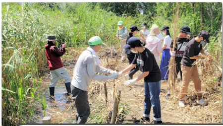
▼大曽根の湿地ピオトープを守る会