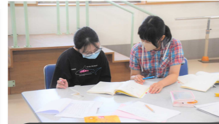
▼We Love 国際交流