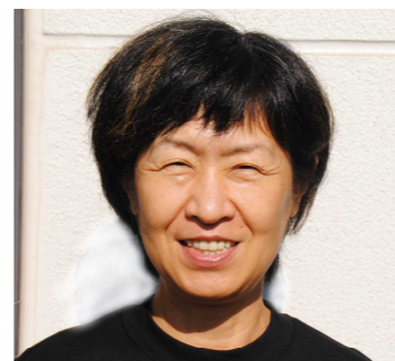
傾聴ふくろうの会