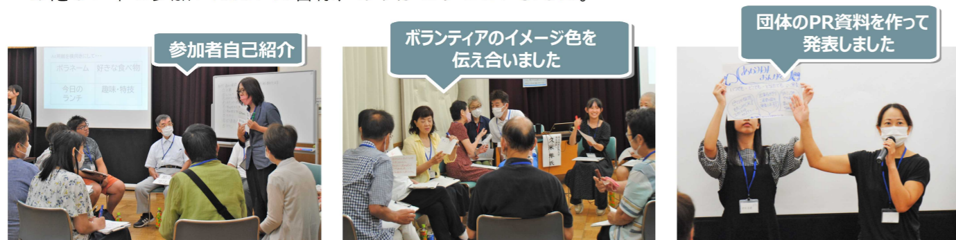
ボランティアで大切にしたい3つのキーワードについて