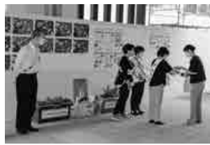
▲八潮市社会福祉協議会 協力委員会