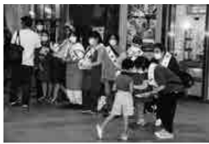
▲八潮市 手をつなぐ親の会