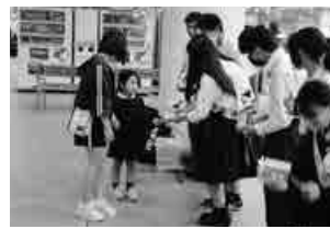
▲埼玉県立 八潮南高等学校