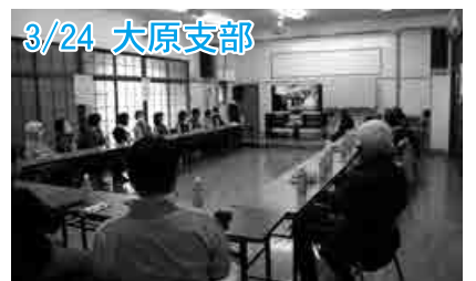
自身の故郷について話したり、防災について学びました。

■問い合わせ先 八潮市社会福祉協議会 TEL048-995-3636 FAX048-995-5287