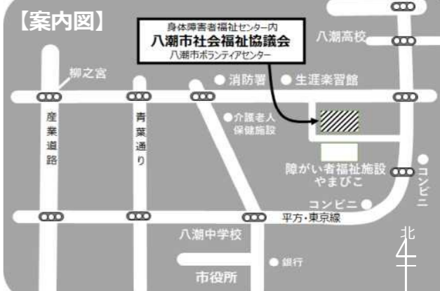
「ぬくもり」は、市内公共施設、小・中・高等学校などの協力により、各施設の窓口に設置しています。

TEL 048-995-3636 FAX 048-995-5287 ホームページ https://yashio-shakyo.jp/