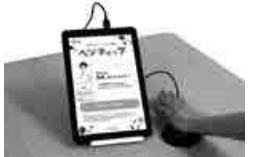
▲あなたの推定野菜摂取量を計測します