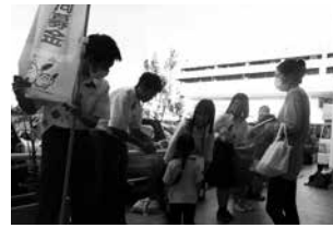
▲埼玉県立 八潮南高等学校