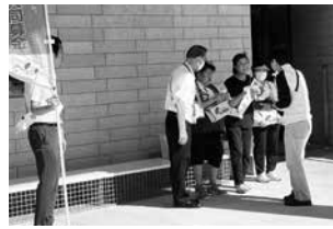
▲八潮市社会福祉協議会 協力委員会