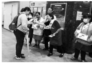
▲八潮市 手をつなぐ親の会