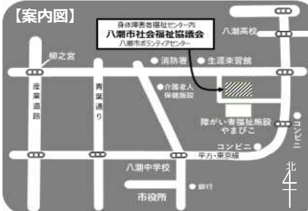
「ぬくもり」は、市内公共施設、小・中・高等学校などの協力により、各施設の窓口を設置しています。

TEL 048-995-3636 FAX 048-995-5287 ホームページ https://yashio-shakyo.jp/