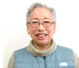
やしおの東サポート隊