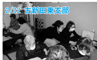
2/22 古新田東支部 脳トレやゲームをした後、昼食を楽しみました。