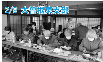
2/9 大曾根東支部 講師を招き、折り紙を組み合わせて置き飾りを作りました。