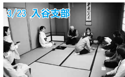
3/23 入谷支部 講師を招き、立てたお茶を、美味しくいただきました。