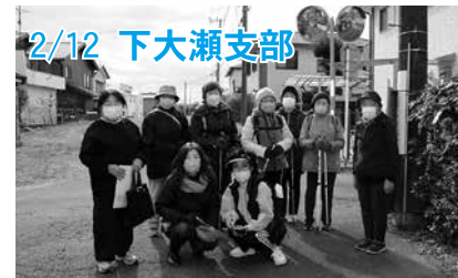
2/12 下大瀬支部 仲間と一緒に、ノルディックウォーキングを楽しみました。