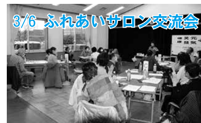
3/6 ふれあいサロン交流会 講師を招き、「ふれあいサロン交流会」を実施しました。