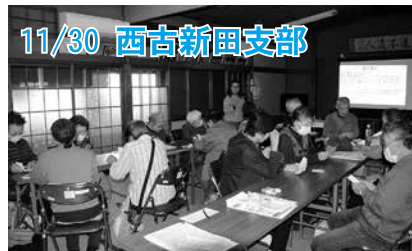
11/30 西古新田支部 講師を招き、自分の「もしも」の時間について、話し合いました。