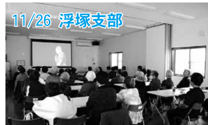
11/26 浮塚支部 お茶菓子をいただきながら、DVDを見て大笑いしました。

■ 問い合わせ先 八潮市社会福祉協議会 TEL048-995-3636 FAX048-995-5287