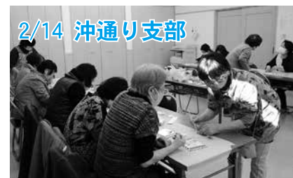
2/14 沖通り支部 講師を招き、「巳」の絵が描かれた置き飾りを作りました。