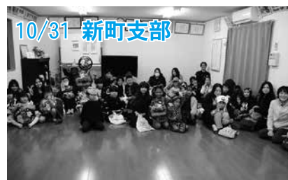
10/31 新町支部 ハロウィン仮装で、町内を回りました。