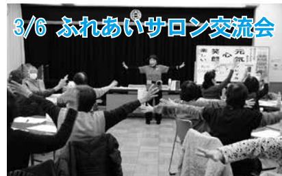
3/6 ふれあいサロン交流会 講師を招き、笑顔になれるレクリエーションを学びました。