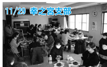
11/29 幸之宮支部 講師を招き、フラワーアレンジメントを楽しみました。