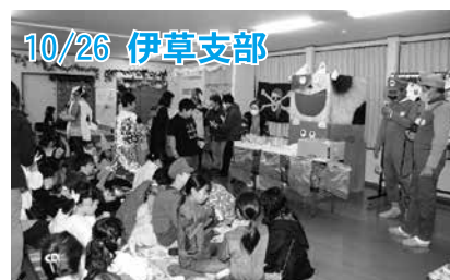
10/26 伊草支部 ハロウィンパーティーを楽しみました。