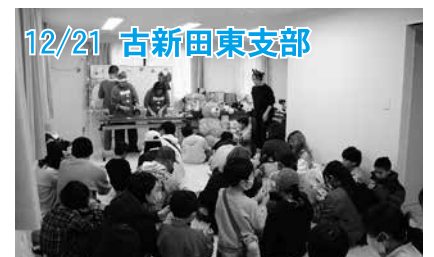
12/21 古新田東支部 子どもから大人までみんなでクリスマスパーティーを楽しみました。