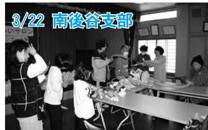
3/22 南後谷支部 地域の方を招き、バルーンアートを楽しみました。