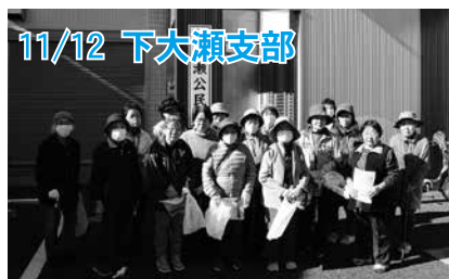
11/12 下大瀬支部 仲間と一緒に、町内の美化活動を行いました。