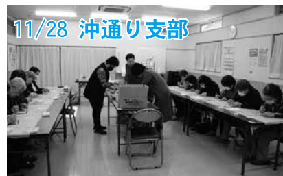
11/28 沖通り支部 講師を招き、「午」のステンドアートを作りました。