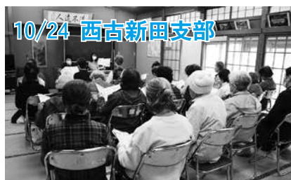
10/24 西吉新聞支部 市職員を招き、介護保険について学びました。

■問い合わせ先 八潮市社会福祉協議会 TEL048-995-3636 FAX048-995-5287