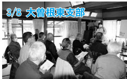
3/8 大曾根東支部 市職員を招き、フレイル予防について学びました。