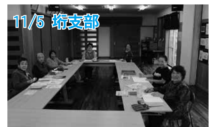
11/5 埴支部 自分のペースで、大人の塗り絵とスクラッチアートを楽しみました。