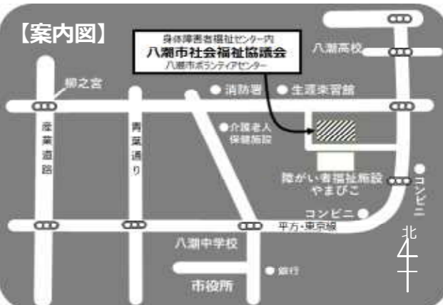
「ぬくもり」は、市内公共施設、小・中・高等学校などの協力により、各施設の窓口に設置しています。

TEL 048-995-3636 FAX 048-995-5287 ホームページ https://yashio-shakyo.jp/